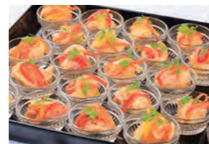
雑賀崎産鯛のエスカベッシュ オレンジ風味