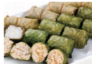
柿の葉寿司 めはり寿司 しらすめはり寿司