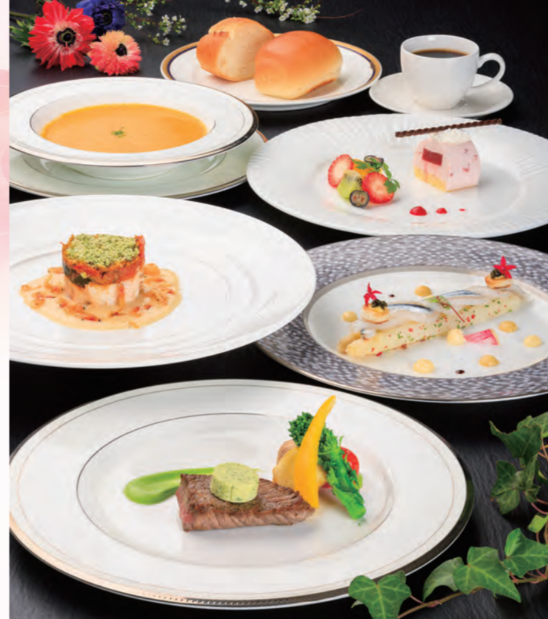
雑賀崎産鯛やサヨリ・桜海老など「春の訪れ」を彩る食材を使ったフルコースです。