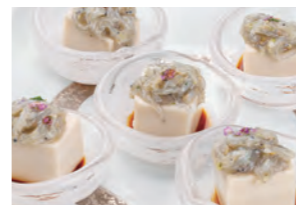
胡麻豆腐と田辺生しらすの なめろう掛け