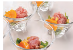
勝浦産タタキ鮪 ユッケ風