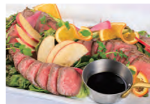
熊野牛モモ肉のタリアータ バルサミコソース