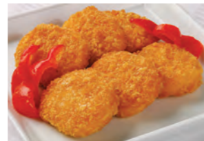
熊野牛と北海道産じゃがいもの 特製コロッケ