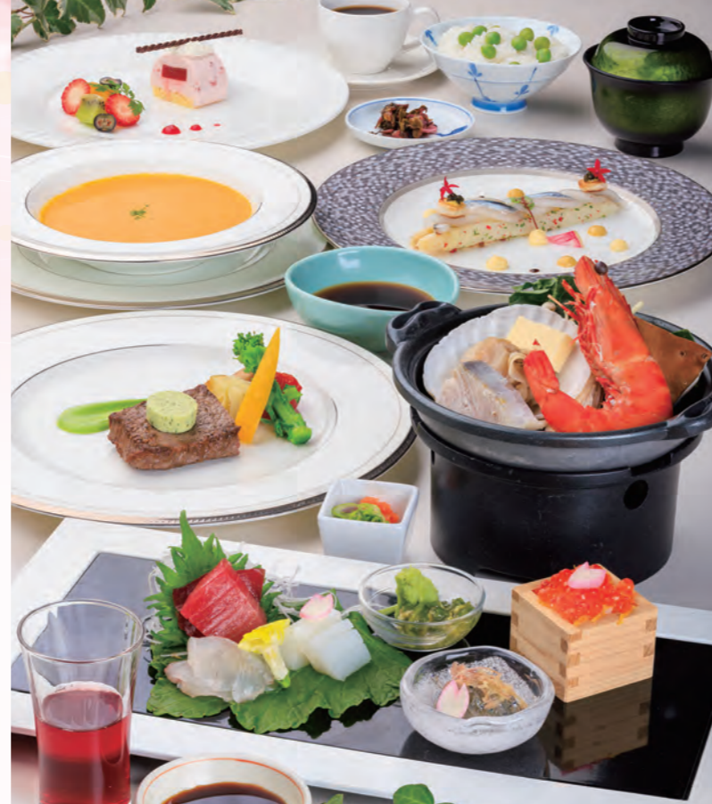
和食・洋食料理長がコラボレーションした和洋一押しの“美味しい”を集めました。