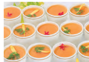
生石豊卵のロワイヤル コンソメジュレ