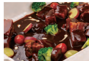
紀州うめふたバラ肉の 赤ワイン煮込み