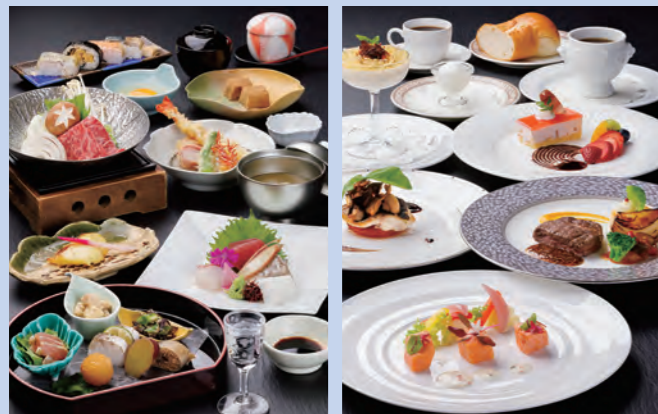
◆会席 ※写真は9,075円 ◆フルコース ※写真は9,075円

■会席・フルコースよりお選びください。 6,655円・9,075円・12,705円