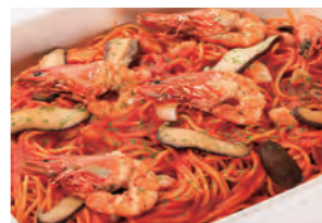
雑賀崎産足赤海老と 龍神産しいたけのトマトソースパスタ