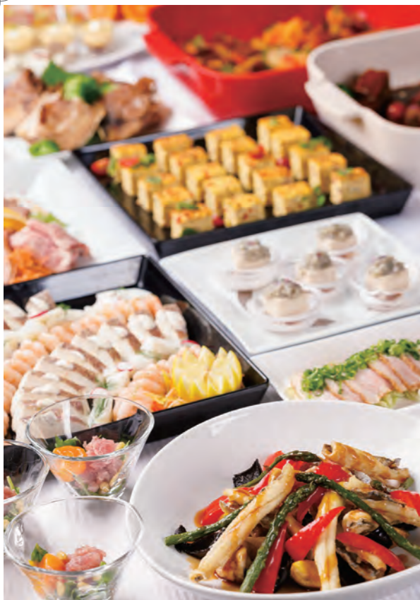
▲上記写真はイメージ