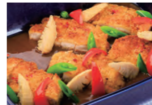
紀の国みかんどりも肉カツレツ デミグラスソース