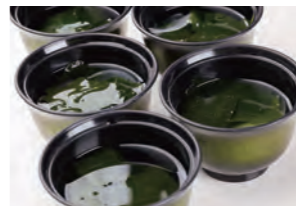
雑賀崎産 魚潮スープ