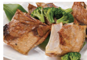
勝浦産鮪のカマ 紀州山椒塩焼き