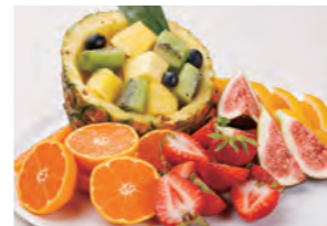
和歌山県産品のフルーツ盛合わせ&デザート盛合わせ