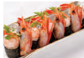
鱈のポワレ 柚子風味のヴァンプソース