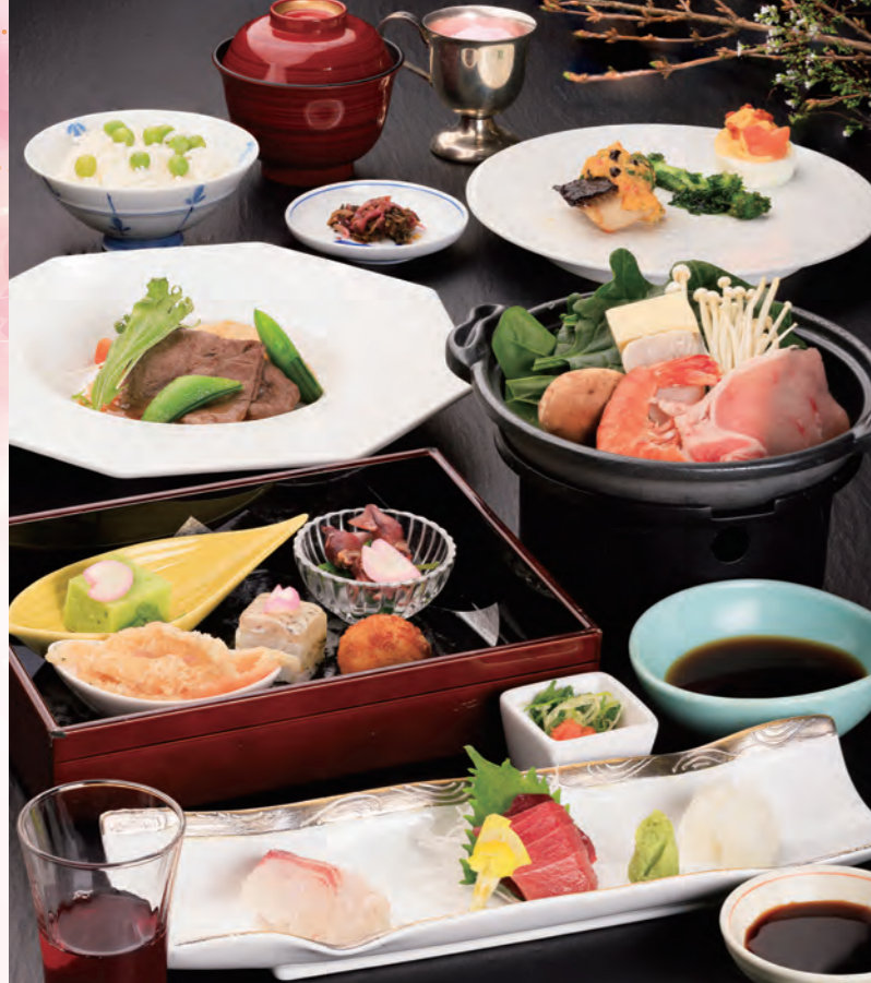
勝浦産鮪や蜆烏賊、桜鯛、うすい豆など、旬の食材を会席料理でお楽しみください。